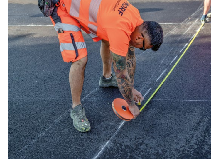
Ausmessen und Vormarkierung mit Kreide