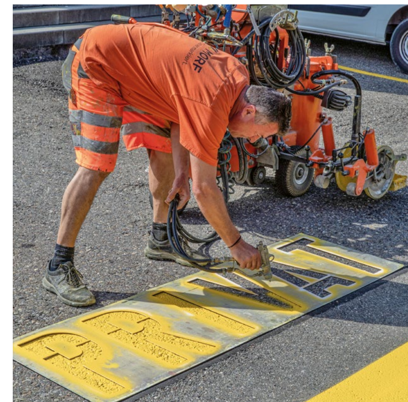
Auszug: Baupraxis Der Tief- und Strassenbau (Band 2) - Kapitel 10.9 Markierung