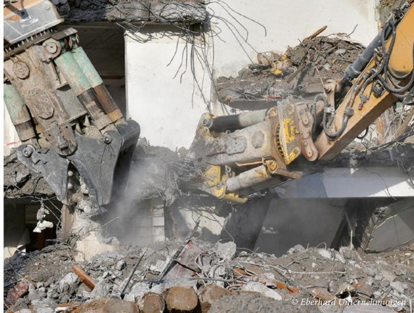
Abbrucharbeiten mit Betonscheren