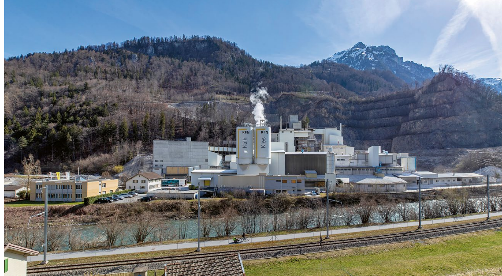
Werk zur Herstellung von Kalkmergel-Deckschichten