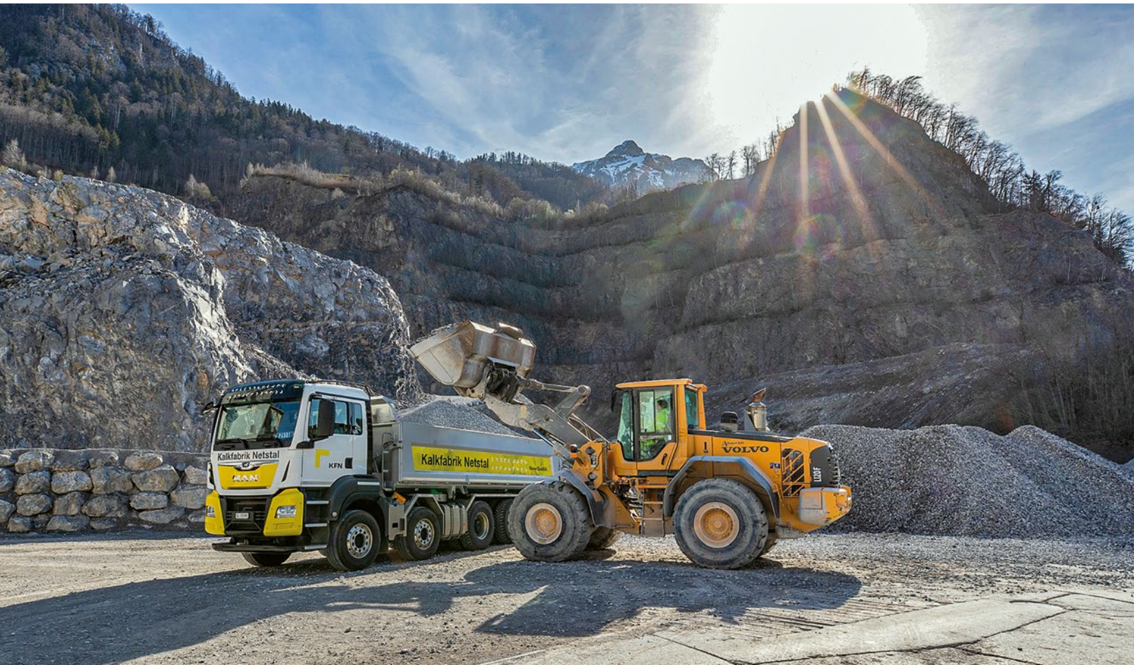
Abbau von Kalkmergel