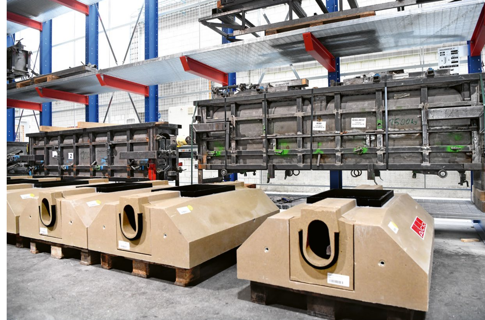
Vorfabrizierte Spezialrinnelemente aus Polymerbeton