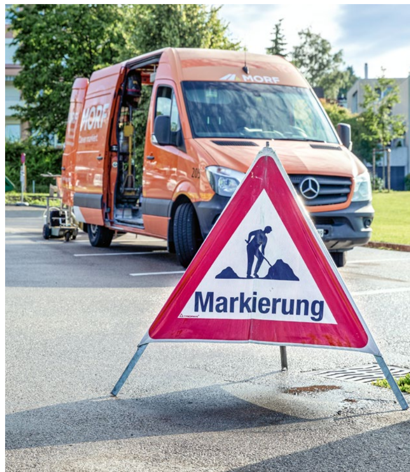
Einsatzfahrzeug für Markierungsarbeiten

Bei Markierungen handelt es sich um farbliche Kennzeichnungen auf Strassenverkehrsflächen. Sie weisen vorgegebene normierte Farben, Formen und Abmessungen auf, sollten möglichst gut sichtbar sein und eine ausreichende Rutschfestigkeit aufweisen. Sie richten sich an alle Verkehrsteilnehmer und umfassen somit Busse, Lastwagen, Autos, Motorräder, Fahrräder und Fussgänger. Sie leisten gemeinsam mit der Signalisation und anderen Leiteinrichtungen (z.B. Leitplanken) einen wichtigen Beitrag zur Erhöhung der Verkehrssicherheit und zur Optimierung des Verkehrsflusses. Es wird zwischen permanenten und provisorischen Markierungen unterschieden.