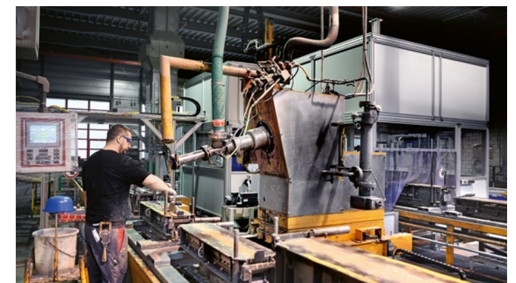
Auszug: Baupraxis Der Tief- und Strassenbau (Band 2) - Kapitel 11.6 Materialien für Schächte

Während üblicher Beton bei der Herstellung von Zementwaren erst nach ca. 5 bis 15 Stunden ausgeschalt werden kann, beginnt das Entformen bei Polymerbeton unmittelbar nach dem Abfüllen. Bereits ca. 10 Minuten nach dem Einfüllprozess ist das Polymerbeton-Element ausgeschalt und härtet dann vollständig aus.