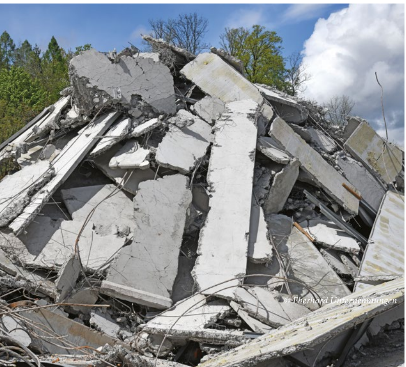
Abbruch von bewehrtem Beton