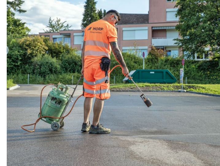
Trocknen der Fläche für das Applizieren der Markierung